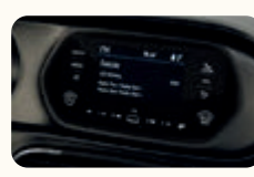
J5 10" COLOR BT (NO TOUCH)