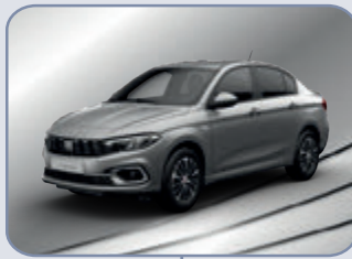
MAESTRO GREY (5DQ-G1Z)