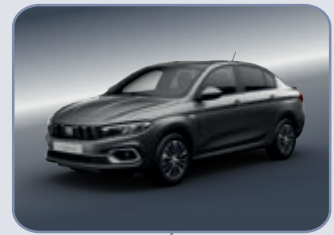
UNDERGROUND GREY (5DR-Gr5)