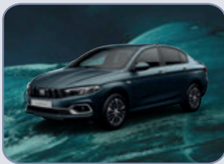
OCEANO BLUE (6FW-PO5)