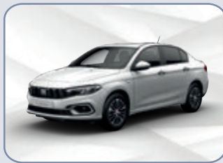
GELATO WHITE (5CA-Z?r)