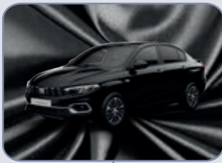
BLACK CINEMA (5CD-713)