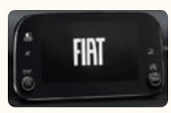
VP7 2" (TSCHNO PUCM)