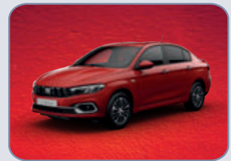
PASSIONE RED (6YI-3G3)