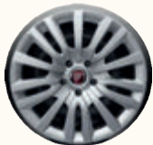
ENTRY 15" STEEL