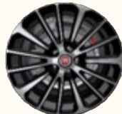
17" ALLOYS 3PP (STYLE PACK)