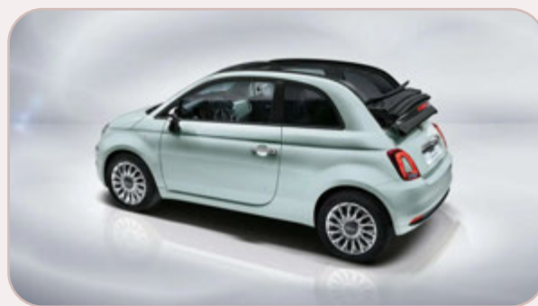
FIAT 500 CABRIOLET 1,2L PACK DOLCEVITA