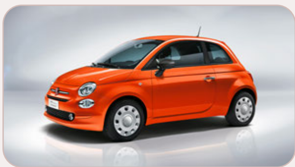
FIAT 500 CULT 1,2L