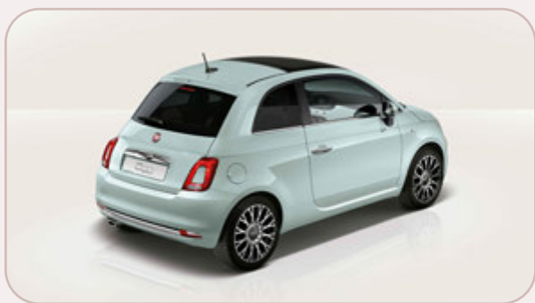
FIAT 1,2 500L PACK DOLCEVITA